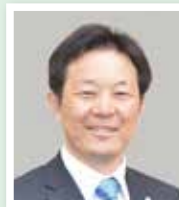
副学長 狐塚 賢一郎 教授