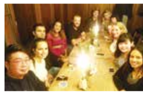
食事会(一番左がSUNさん)