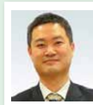
副学長 朴 昌明 教授