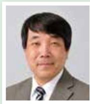
副学長 本池 巧 教授