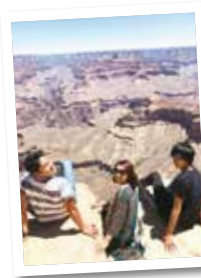
グランドキャニオン