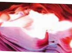
アッパーキャニオンにて