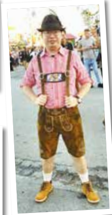
オクトーバーフェストの衣装