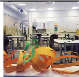
Karajokiの初等教育の教室

コロナ禍でオンライン教育が一気に進みました。世界が縮まり、フィンランドに限らず、いつでもどこでも何でも学べる環境になったといえます。学び続けること、これをするかしないかは自分次第です。