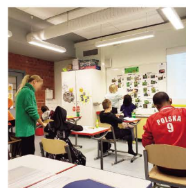
Ouluの学校の教室にて