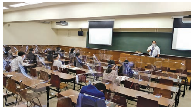
セミナー実施の様子