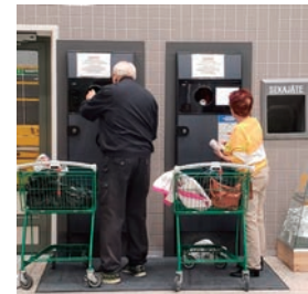
スーパーの一角に設けられた回収のためのマシン