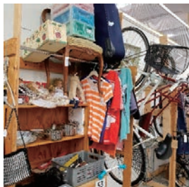
リサイクルショップの様子

フィンランドでよく見るリサイクルショップ。衣類や食器、雑貨、靴、スキーやスケート、自転車など、時には用途不明なものも。とにかくいろんなものが販売されていて、フィンランド人の生活を垣間見るようでとても楽しいところです。程度はいろいろですが、よく吟味すれば、とてもリーズナブルに購入できるので、フィンランドに来たばかりの頃、生活必需品を買うのに利用しました。街中には複数リサイクルショップがあり、それぞれに個性があるのですが、その形態は個人で棚を借りて値段をつけて販売している店舗と寄付により運営している店舗があります。前者は1週間に25~30ユーロで棚を借りることが多いようです。後者は地域の福祉施設や赤十字が経営しています。私も時々不要になった衣服や靴、雑貨を持参しています。実店舗だけでなく、ネット上でも日本でいう「メルカリ」と同じような形態の、「Netflea」や「Tori」などといったアプリがフィンランドではよく利用されています。フィンランドは循環経済、つまり限られた資源をどのように将来に活かしていくか、いかに循環させるかのロードマップをいち早く掲げた国です。モノを大事にする文化が根付いています。