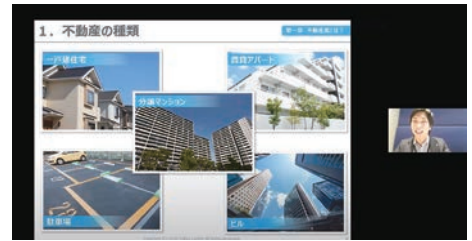
企業説明会実施の様子

キャリアセンターでは、新型コロナウイルス感染症拡大防止の観点から合同企業説明会の開催方式を対面からオンライン（WEB）に切り換え、2月から毎月開催をしています。1日で数多くの企業と出会える合同企業説明会には、毎回多くの就活生が参加して納得のいく内定先を獲得するために真剣に取り組んでいます。