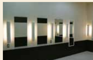
第二講義棟パウダーコーナー

講義棟3・4F、大学会館3F及びメディアセンター5Fの女性用トイレと、第二講義棟地下1F女子ロッカー室内にパウダーコーナーを設置します。