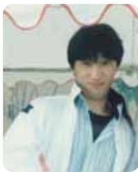
在学時は「サエラ」(テニスサークル)で活動していました