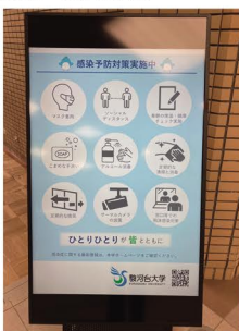
2019年度卒業生から大学への卒業寄付(デジタルサイネージ)

スタイリッシュなデザインで、メディアプレーヤー内蔵のディスプレイです。電源を入れるだけでUSBメモリ内のコンテンツを自動再生できます。新型コロナウイルス感染症対策にも、早速、活用させていただいております。