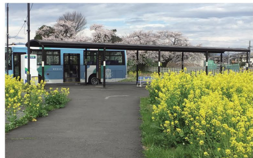
元加治駅バスステーション

埼玉県飯能市阿須698 駿河台大学同窓会事務局(学生支援課内) TEL 042-972-1101 FAX 042-972-1149 E-mail dousou@surugadai.ac.jp