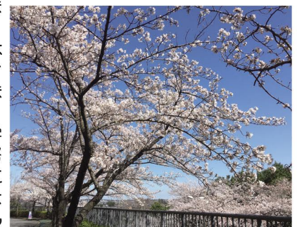
キャンパス内の桜

本年度の企画にご協力いただいた卒業生の皆さまをはじめ、ご後援いただいた本学同窓会の皆さまに深く御礼申し上げます。今後も学生の進路選択に役立つイベントを企画・運営していきたいと存じますので、引き続きご支援・ご協力のほどお願い申し上げます。