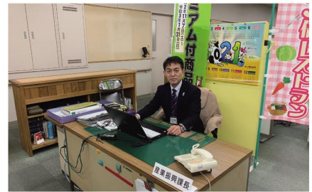
勤務先(飯能市役所産業振興課)にて