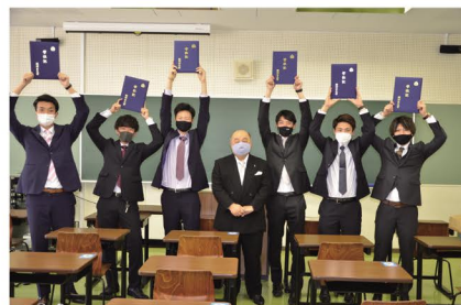
2020年度 学位記授与式(卒業式)当日の様子